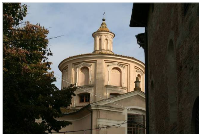
San Miniato: la cupola del Santuario del Santissimo Crocifisso