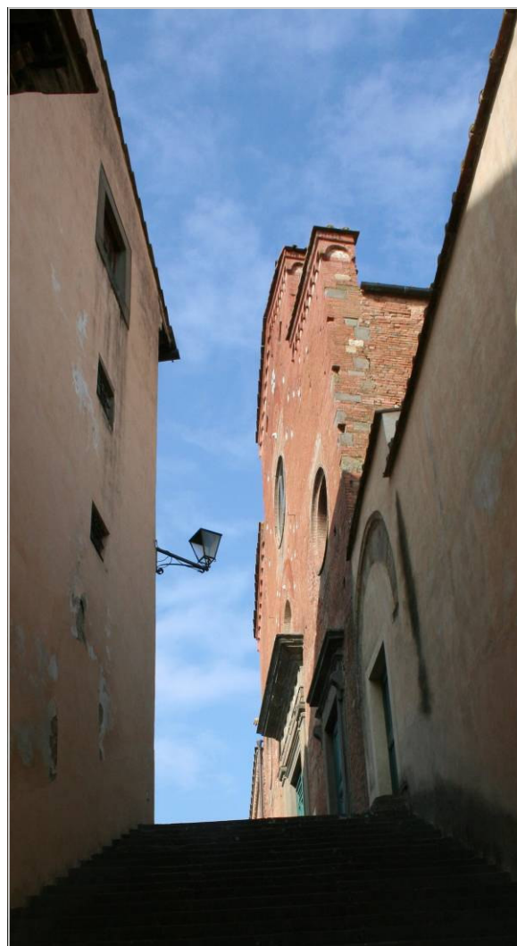
San Miniato — la Cattedrale