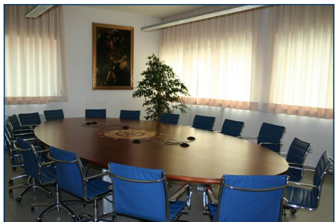
la sala consiliare

L'incarico di Direttore Scientifico è conferito, con deliberazione motivata, dal Consiglio di Amministrazione, anche a soggetti non facenti parte del personale dell'Istituto, purché in possesso di adeguati requisiti tecnico professionali. L'incarico ha durata quinquennale ed è rinnovabile.